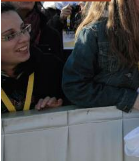
Mons. Domenico Sigalini saluta i ragazzi dell'Ac in piazza San Pietro

Ogni sacerdote in servizio pastorale presso un'aggregazione laicale ha una doppia appartenenza, quella associativa e quella ecclesiale: la prima per comprendere e vivere il carisma di ogni gruppo, aiutando così la crescita formativa dei componenti; la seconda “di fine”