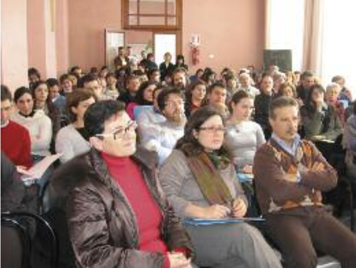
L'incontro della delegazione del Lazio

certezze. Proprio da queste siamo partiti dunque: essere responsabili. Primo fra tutti, vuol dire scegliere di rispondere con gioia ad una chiamata particolare. Ecco il cuore di questo cammino di formazione: riscoprire la gioia di mettersi al servizio dei volti che incontriamo lungo il nostro cammino, in una comunità educante: in Ac, forse anche per un periodo limitato nel tempo, e per tutta la vita come cittadini degni del Vangelo.