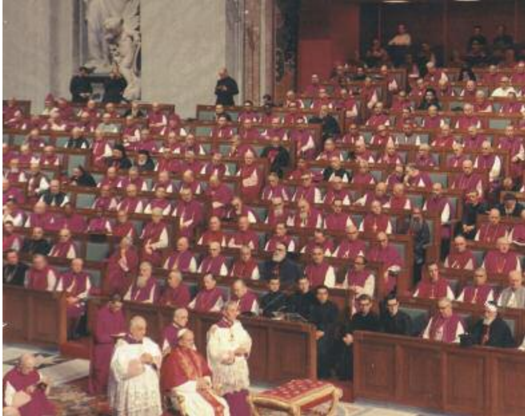
Paolo VI assiste a una sessione del Concilio Vaticano II

Scelta religiosa, dunque, affermava Bachelet, «vuol dire che l'annuncio di Cristo può diventare fermento di civiltà, di cultura, di impegno sociale, di impegno politico; vuol dire anche che, se c'è un compito della Chiesa e, in essa, dell'Ac che si qualifica per essere la più vicina al cuore della sua missione, è quello di sfrondare tutto ciò che non è essenziale per andare all'essenziale, cioè all'annuncio di Cristo morto e risorto per noi, perché da questo possa germogliare l'affermazione, la crescita, la promozione dei valori cristiani e dei valori umani in una realtà che può essere nuovissima e in cui questi valori possono essere realizzati in forme antichissime, ma anche in forme totalmente nuove».