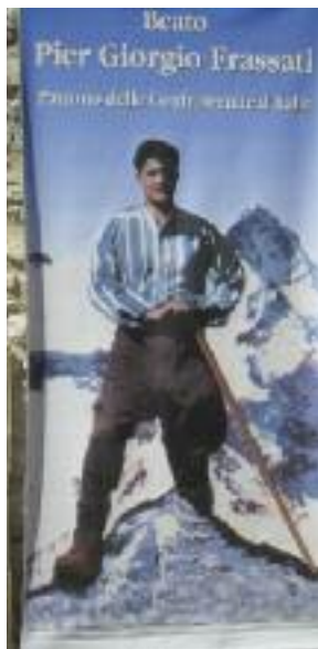
Uno dei pannelli della mostra