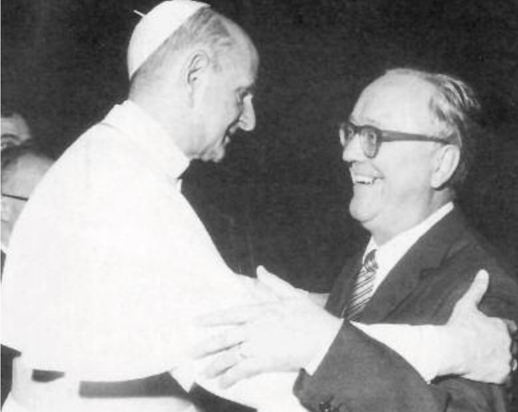
Paolo VI abbraccia Vittorio Bachelet, "padre" della scelta religiosa

nel corso degli ultimi decenni, è stata contestata, ad essa sono state attribuite "colpe" di vario genere: dalla crisi dell'associazione a quella del partito di ispirazione cristiana. Si tratta di critiche superficiali e non motivate. Se mai, non alla scelta quanto ad una modalità di attuazione possono essere attribuite delle responsabilità. Quella scelta in realtà, operata negli anni del Concilio vaticano II con la Chiesa italiana, comportava due sottolineature ancora valide.