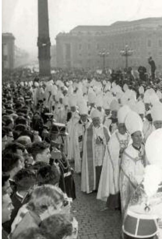
Una delle immagini più significative del Concilio: i padri conciliari escono in

Vi è bisogno di una creatività che risponde alle esigenze del presente, senza farsi frenare da una sorta di purismo che vede la scelta religiosa come qualcosa di spirituale e insieme di astratto. Così come vi è la necessità di ripensare strumenti e forme storiche... perché l'associazione non è un museo. Potrei esemplificare riferendomi al tema della famiglia, a quello dell'educazione,