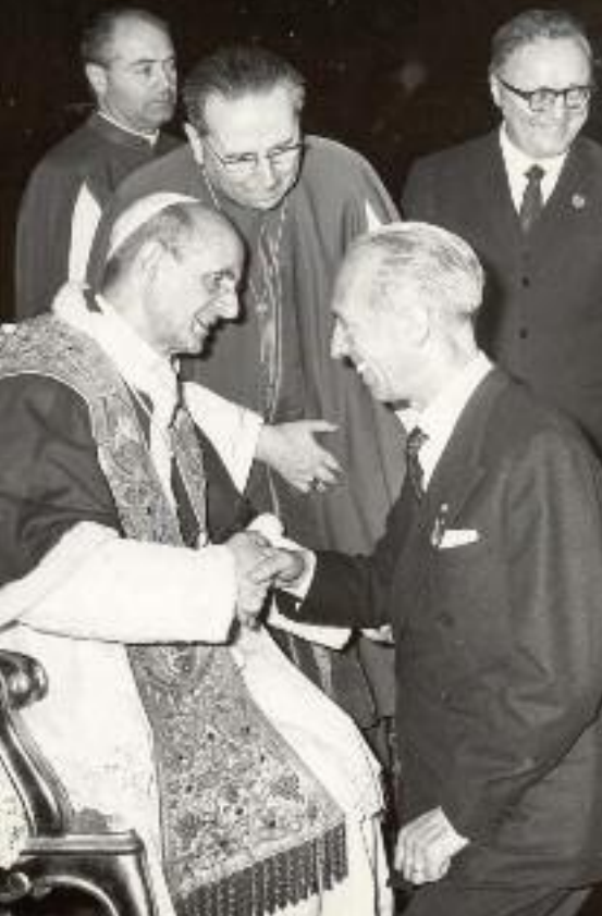
I due presidenti di Ac, Maltarello e Bachelet, con Paolo VI

ro che inizia già oggi e ha la luce serena e paziente della speranza.