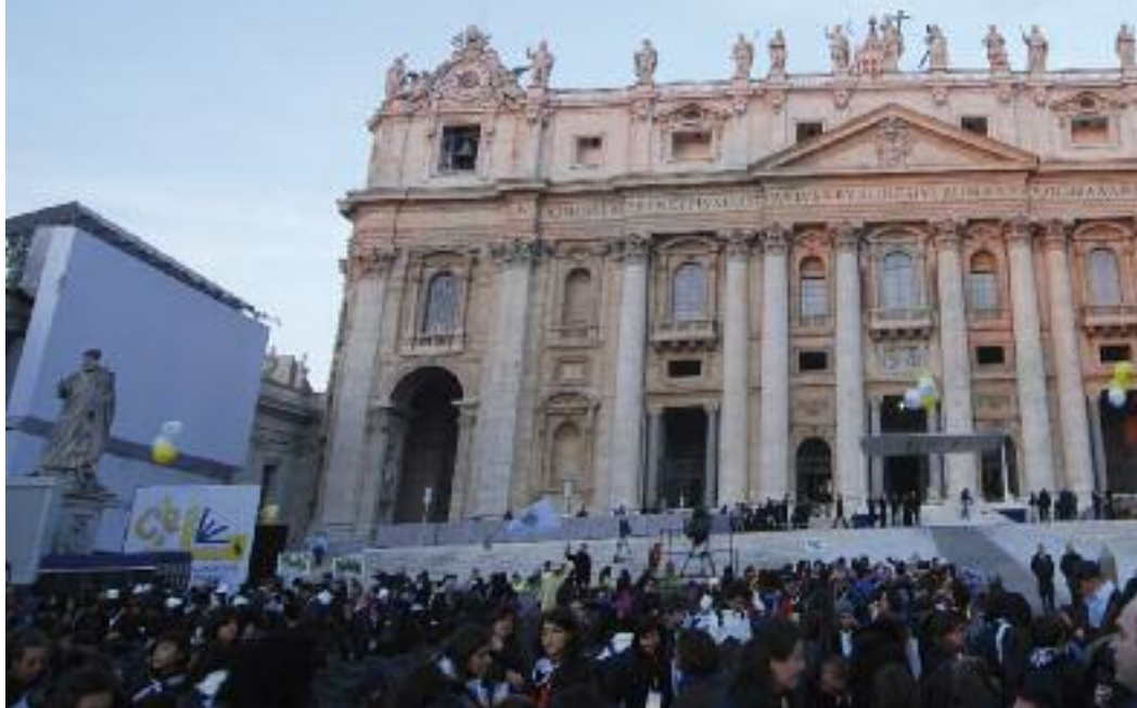
Piazza San Pietro gremita dal popolo di Ac il 30 ottobre scorso

le bellezze e le sorprese della vita di fede».