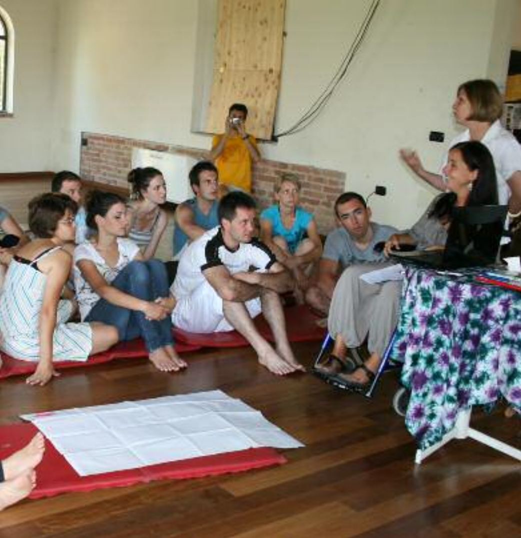
In questa foto e nella pagina seguente: il campo scuola multireligioso di Parma

ti e altrettanti modi di vivere la giovinezza in Bosnia Erzegovina. «Quando si visita la Bosnia tende sempre a risaltare la faccia peggiore di quei luoghi. È stato un piacere vedere, invece, che ci sono giovani che hanno veramente voglia di ripartire, di superare le divisioni a partire dai rapporti personali, e che lo fanno con molta naturalezza, senza essere forzati. Penso che in Italia tutti noi abbia-