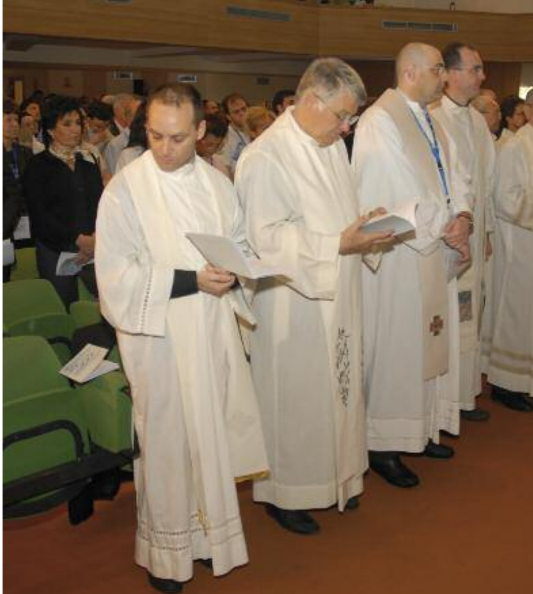
Gli assistenti di Ac durante un momento di preghiera con i delegati di una Assemblée nazionale

Laici: I sacerdoti nelle associazioni dei fedeli , n. 9).