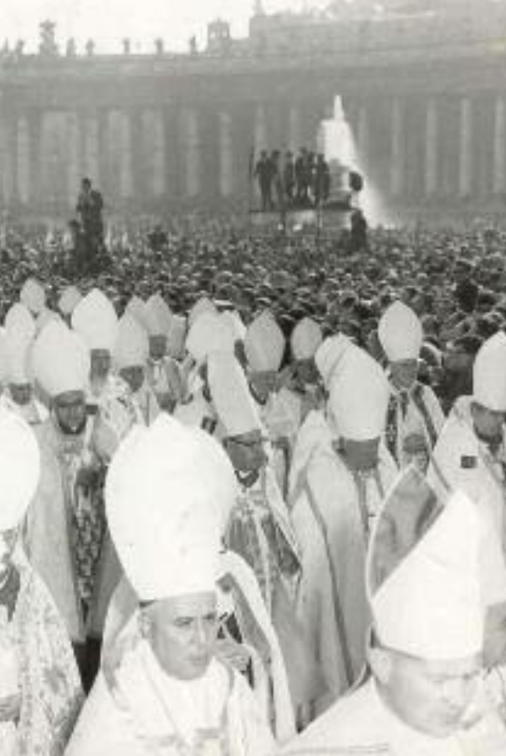
processione tra la gente a piazza San Pietro

ogni giorno? Come fare a rendere presente nelle comunità diocesane e parrocchiali un'Associazione che viva una fraternità feconda e non si limiti a spendersi in alcuni servizi? Come dalla scelta religiosa può venire lo stimolo a far sì che un gruppo parrocchiale sia una proposta esigente e praticabile di vita cristiana? E infine, come realizzare nei percorsi formativi quella necessaria lettura delle esigenze del mondo in cui viviamo? Come favorire e sostenere, attraverso l'individuazione di strumenti esistenti o la creazione di nuove possibilità, quell'impegno sociale e civile che non si fermi ad un generoso volontariato personale, ma che si esprima nel contesto storico e politico grazie alla formazione